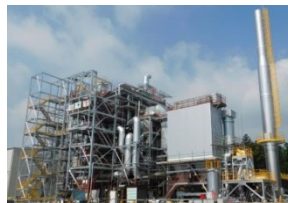
前橋バイオマス発電所