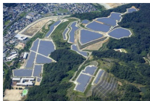
嘉麻第一太陽光発電所