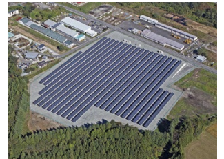
十和田太陽光発電所