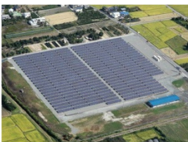
久留米太陽光発電所